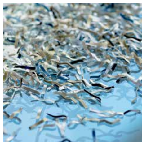
Stupeň utajení P-5: Doporučuje se pro datové nosiče s tajnými údaji