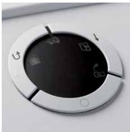
Přehledný komfortní ovládací panel ke snadnému, intuitivnímu ovládnání se svítícími symboly a akustickými signály