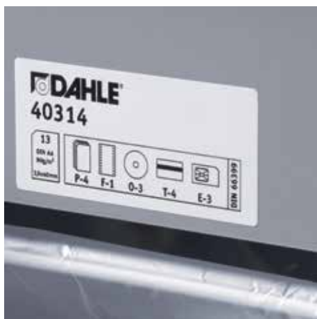
Jasně označené výkonové charakteristiky na skartovací pro správnou obsluhu